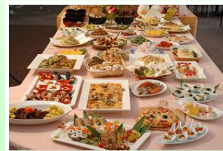
バイキング1,500円(税込み)

和・洋・中、40種類を取り揃えた食べ放題バイキング。栃木の旬の食材をいりとりどりに味わえます。