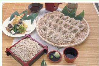
手打ちそば 730円(税込み)～

国産そば粉使用の「二八そば」は絶品です。素朴な風味となめらかなのごしを、ぜひ一度ご賞味ください。