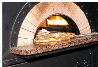
ゆり根ピザ 1,300円(税込み)