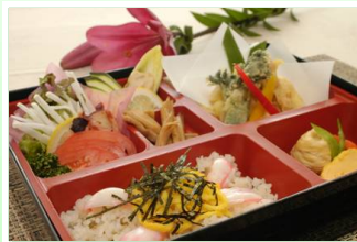
ゆり御膳 1,200円(税込み)

ゆり根の天ぷら・炊き合わせなど、この時期だけのゆりづくしをご堪能ください。 (地産地消推進店認定)